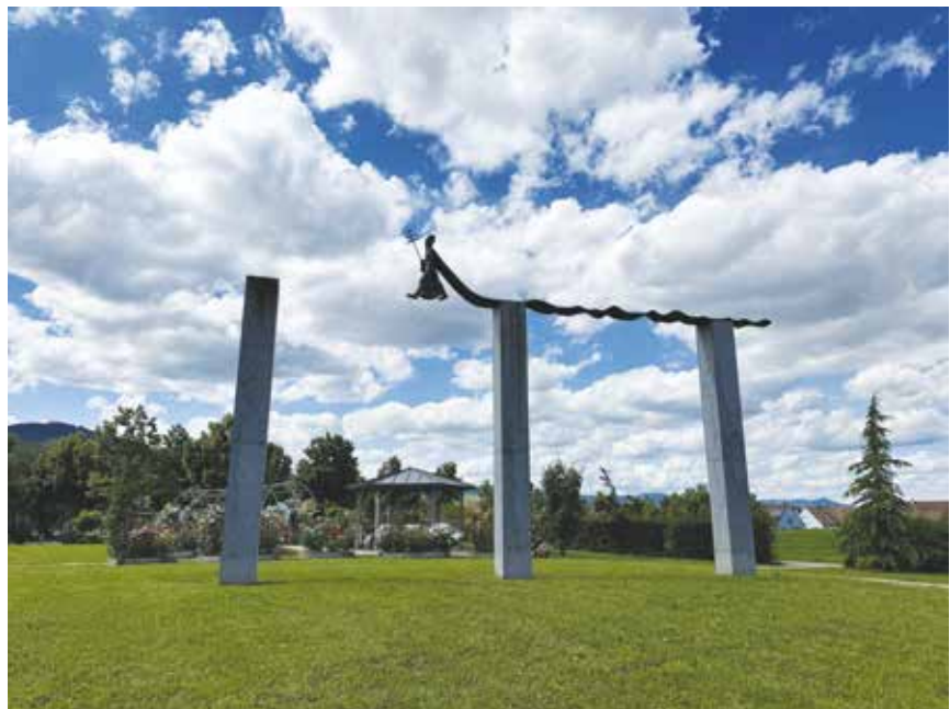
Le pape Léon IX réalisé à Eguisheim en 2012.

En plus de son engagement dans l'atelier, M. Schické crée des sculptures monumentales ou petites pièces destinées à la vente en galeries. Il expose depuis 1977 et ses créations prennent place dans l'espace public depuis 1978. Après Baldenheim, Eguisheim ou encore Kintzheim, c'est à Marckolsheim que prend vie sa dernière création, hommage appuyé aux alsaciens victimes de l'évacuation de 1939.