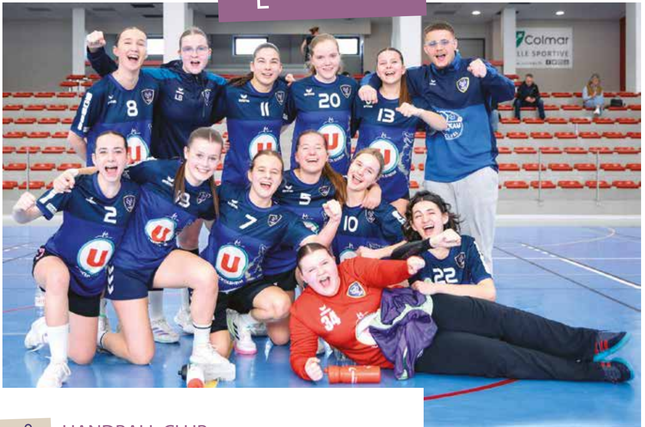
Moins de 18 ans Féminines