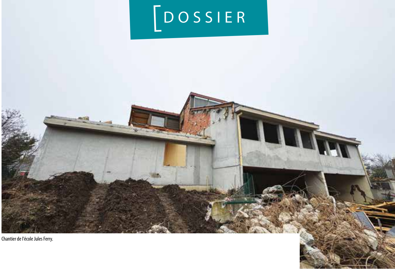
Chantier de l'école Jules Ferry.