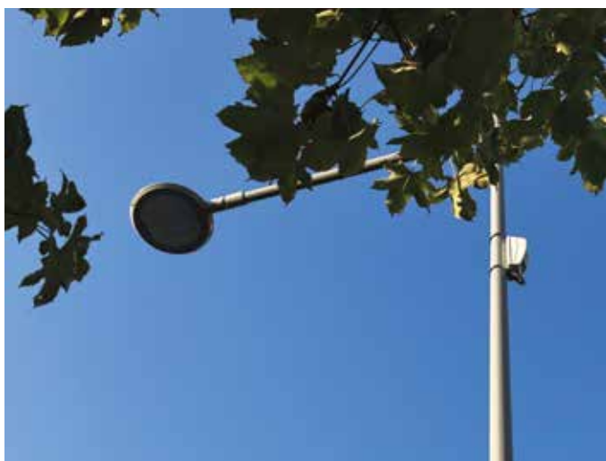
Nouvel éclairage public.