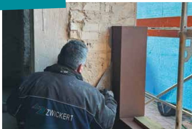
Travaux de rénovation de l'ancien Tribunal.

Une avance de 7 000 € est inscrite au profit du budget annexe "nouveau quartier Schlettstaderfeld".