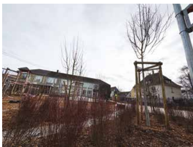
Plantations École Brant.