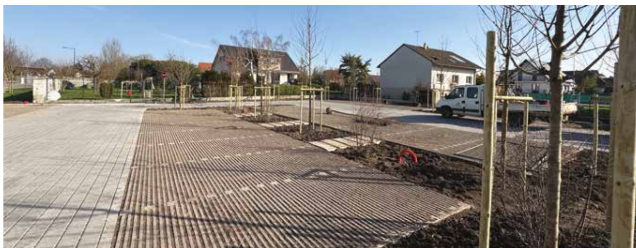
Parking rue de l'Hôtel de Ville.