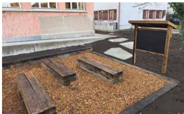
Classe du dehors École Brant.