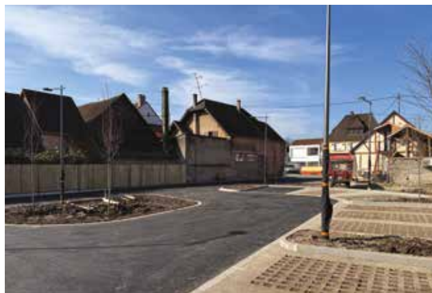
Parking rue du Maréchal Joffre.