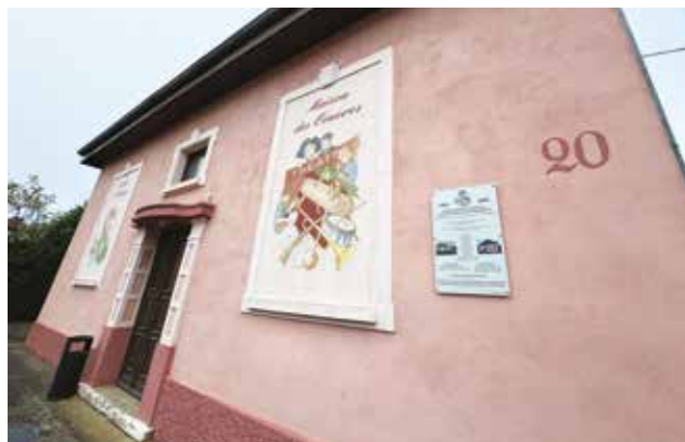
Maison des Œuvres.