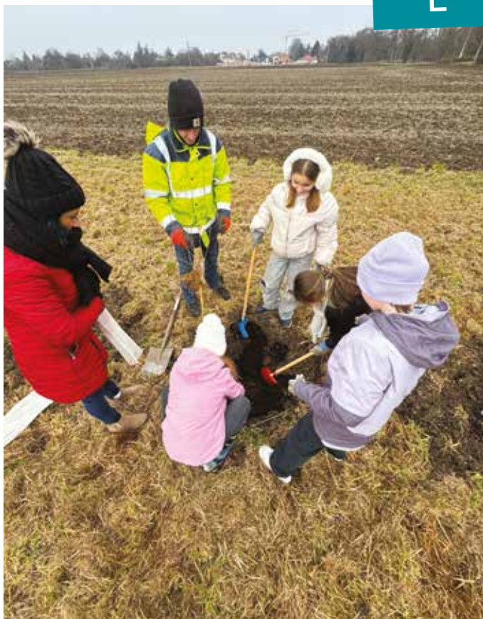
Plantation d'arbres avec le CME.