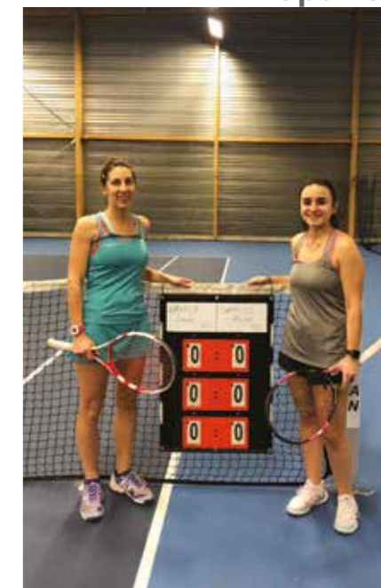
Les finalistes ont pris la pose avant de se disputer le titre !

tenue du bar pour servir les joueurs assoiffés et ravis de boire un verre en fin de partie. Au tennis, on n'a jamais tout perdu, puisque le fair play veut que le vainqueur offre un verre au perdant.