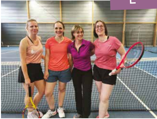
Nos joueuses Raquettes FFT, ravies de leur première expérience en compétition.