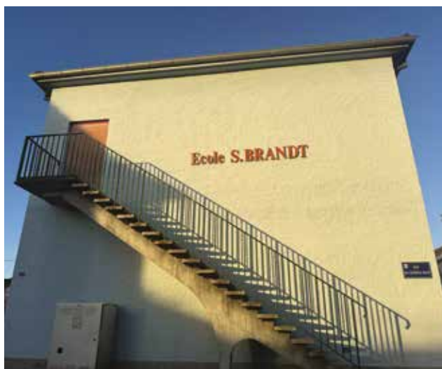
La construction d'un nouvel escalier de secours est programmée à l'école Brant. Les travaux devraient débuter cet été.