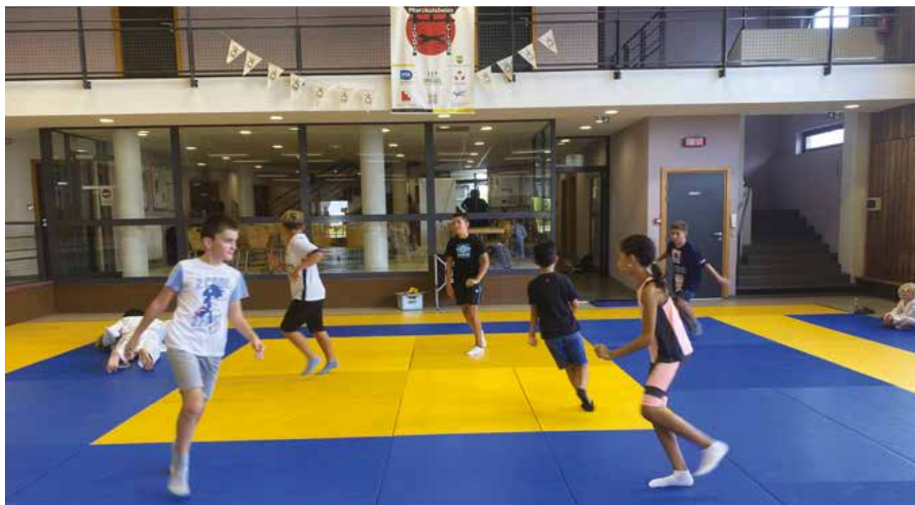
Fête du sport.