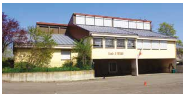
Travaux d'extension et restructuration de l'école Jules Ferry : Un concours d'architecture est en cours.