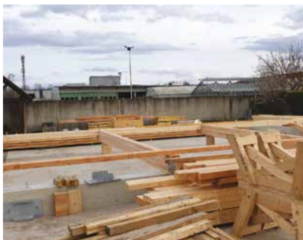
Hangar à bois aux ateliers des espaces verts.