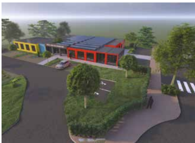
Construction d'un pôle des solidarités rue du Tilleul. Il accueillera les services sociaux présents sur le territoire.

Aménagement d'une chaufferie bois et réseau de chaleur (Maison anc. MLM, presbytère, école élémentaire Brant et maison Kolb) : 175 000 € (solde de l'opération)